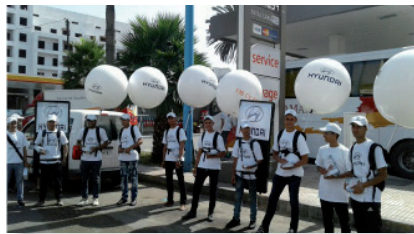
Opération de street marketing avec ballons sac à dos. HYUNDAI