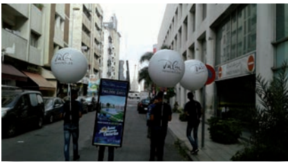
Opération de street marketing avec panneaux sac à dos. PALM IMMOBILIER