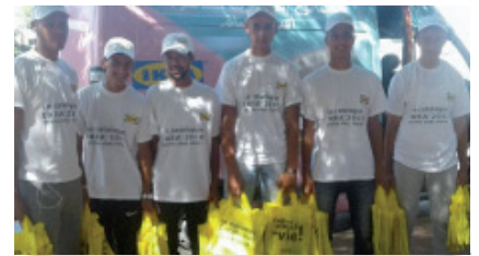
Distribution de catalogues annuels IKEA.