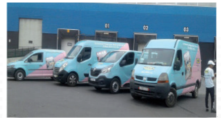
Roadshow avec habillage de véhicules.