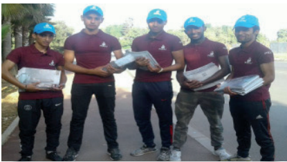
Distribution de catalogues. FAOU